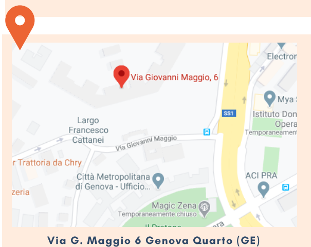
Via G. Maggio 6 Genova Quarto (GE)

Il Centro si occupa di pazienti affetti da Disturbi Specifici dell'Alimentazione che hanno compiuto il quattordicesimo anno di età .